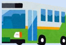
公共交通手段の利用