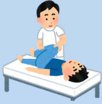
可動域練習 マッサージ