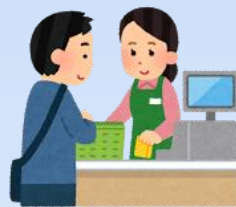
いつものスーパーで買い物