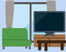
あのソファから 立ち上がり