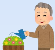
趣味のガーデニング