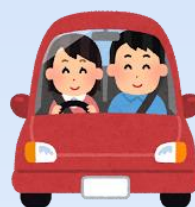
自動車運転に関する 高次脳機能評価